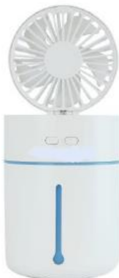
H Hygiene Solution 20-40 (Raumvolumen 20-40 m3)

Mit dem H Hygiene 20-40 Gerät in Verbindung mit der gebrauchsfertigen NeutroDes AIR Lösung, kann die Ansteckungsgefahr durch Tröpfcheninfektion in geschlossenen Räumen um min. 70% gesenkt werden. Die Oberflächendesinfektion mit Langzeiteffekt desinfiziert alle Oberflächen im Raum, sodass Sie sich wieder auf die Reinigung konzentrieren können. Das einzigartige Verfahren inaktiviert Viren und Bakterien in der Luft in den Aerosolen - den ganzen Tag.